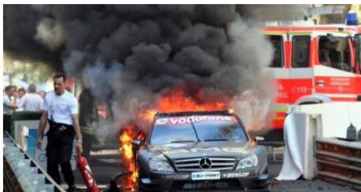
Riesenspektakel: DTM-Präsentation 2006 auf der Kö